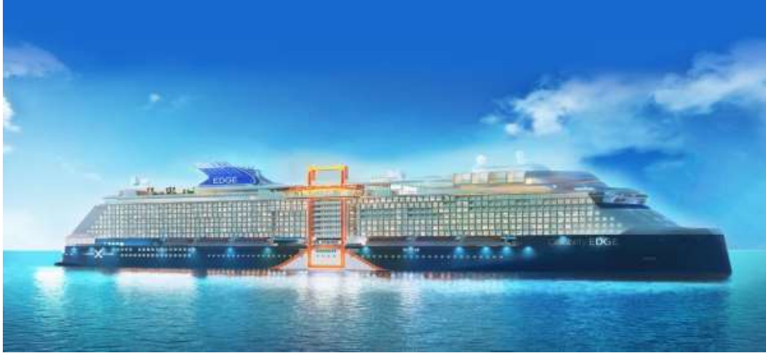
“ Celebrity Edge “