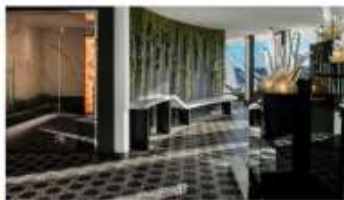
SEA Thermal Suite

Enjoy dining in this exclusive restaurant, featuring inventive dishes crafted by our Michelin-starred chef.