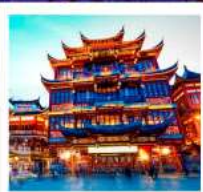
ศาลาร้อยปีเจิ้งหวงเมี่ยว