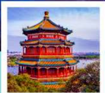
พระราชวังฤดูร้อนอ้อหยวน