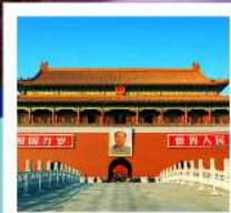
พระราชวังต้องห้ามปักกิ่ง