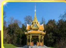
ศาลาไทยโซซานน์