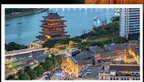
ถนนคนเดินสามตรอกสองซอย