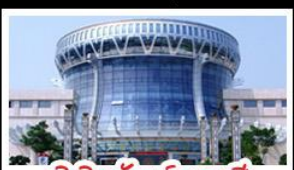
พิพิธภัณฑทักวางสี

สวนสนุก FANTASYLAND - หมู่บ้านสไตล์ยุโรป พิพิธภัณฑทักวางสี - ถนนคนเดินสามตรอกสองซอย ท่าเรือกิ่งจ้อ - ศาลเจ้าแม่กวนอิมพันกร เมนูพิเศษ อาหารกวางตุ้ง , สุกี้ชาบูหม่าล่า