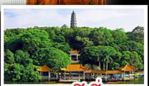
กุหาซิงชีว