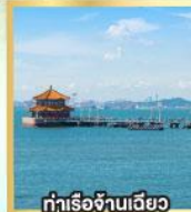
ท่าเรือจ้านเจียว