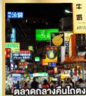
ตลาดกลางคืนโตง