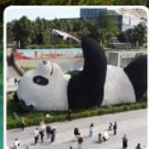
รูปปั้นหมีแพนด้าเซสพี

แวะชิมบึงย่างหม่าล่า ร้านคุณพ่อ (แห่งแรก) ที่เมืองเล่อซาน เดินทาง