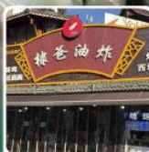
ร้านบึงย่าง ของพ่อหวังเหอดี