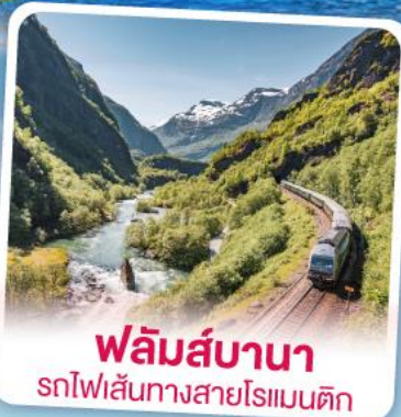
พลิมส์บานา รถไฟเส้นทางสายโรแมนติก