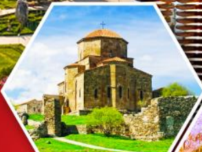
วิหารลวารี