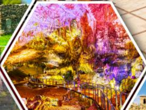
น้ำพุรมบิซูล