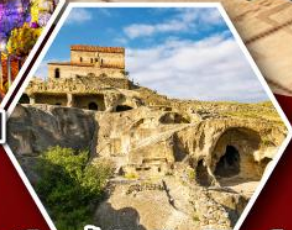
เมืองน้ำอพลิสตซิคเค์

พัก Rooms Hotel โรงแรมวิวทิวทัศน์ของเทือกเขาคอเคซัส