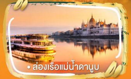
• ส่องเรือแม่น้ำดานูบ

ไฮไลท์ในโปรแกรม • เยอร์ เมืองเก่าสุดคลาสสิก ฟีลยุโรปเต็มสิบ • เก็บโมเมนต์สวย ๆ ในบูดาเปสต์ เมืองแห่งแสงไฟ • บราติสลาวา เมืองเล็กแต่น่ารักเกินต้าน • เบอร์โน ซิลส์ง่าย สไตลยุโรปแท้ ๆ • คาร์โรวัวร์ เมืองน้ำแร่ • ซาลสบูร์ก เมืองดนตรี วิวดีทุกมุม • เวียนนา เมืองหรรุคลาสสิก สมมญยุโรปสุด ๆ