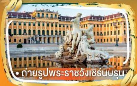
• ถ่ายรูปพระราชวังเซรินบรุน