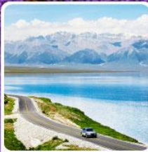
ทะเลสาบไซ่หลี่มู่