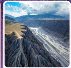
แกรนด์แคนยอนตู่ชานจื่อ