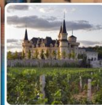
ไร่ไวน์ จุนยี่ เขิงหน่าอิด