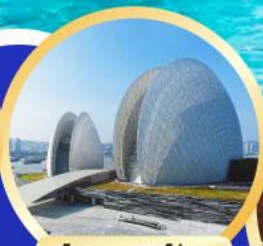
โรงละครหยกไข่มุก