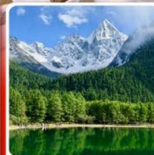
อุทยานบึงเพ็งไถว