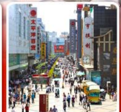
ช้อปปิ้งถนนคนเดินซุนซีลู่