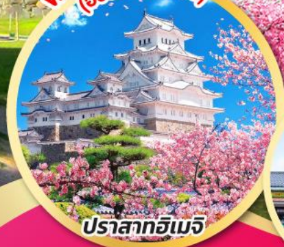
ปราสาทฮิเมจิ