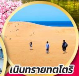
เนินทรายทตริ

ผลิตผลิตภัณฑ์จากธรรมชาติ แบบใหม่แบบล้ำ ทันใจไม่เจะ