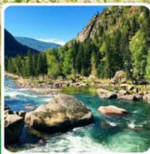
อุทยานเคอเคอทั้วไห่