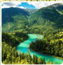
ทะเลสาบคานาสือ