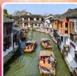
หมู่บ้านโบราณจูเจียเจี๋ย