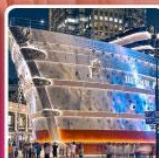
เรือหลุยส์