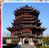
วัดจวงหยวน