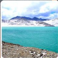
ทะเลสาบคาราคูล