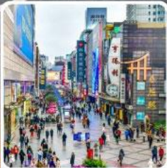
ถนนคนเดินซุนซีลู่