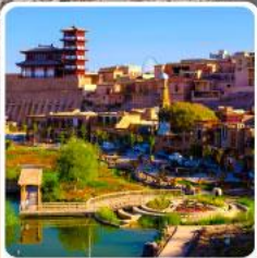
เมืองเก่าคัชการ์