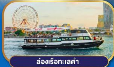
ส่องเรือทะเลดำ