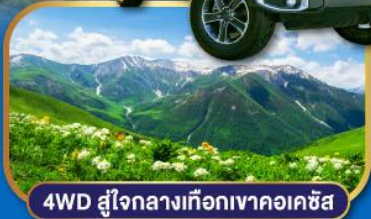
4WD สู่ใจกลางเทือกเขาคอเคซัส