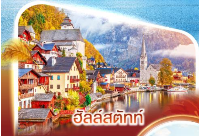
อัลลส์ตัทท์