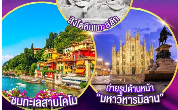
ชมทะเลสาบโคโม