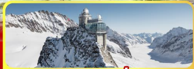
ยอดเทวจุงเฟรา