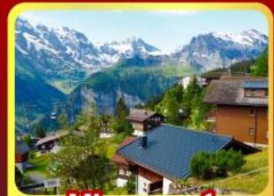
หมู่บ้านเมอร์เรน