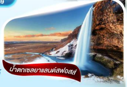
น้ำตกเขลยาแลนด์สฟอสส์