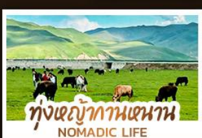
ทุ่งหญ้ากานหนาน NOMADIC LIFE