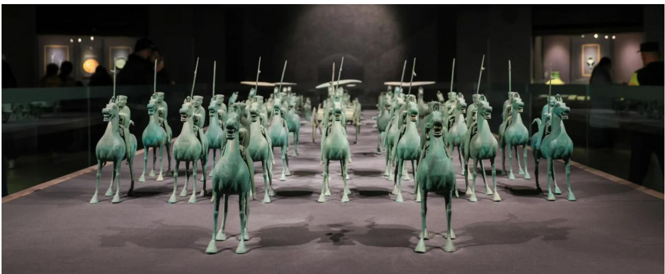
บ่าย นำท่านเข้าชมอารยธรรม ณ พิพิธภัณฑสถานหลานโจว อย่างเท่าเข้าสู่โถงอันโอ่อ่าของพิพิธภัณฑสถานหลานโจว ราวกับได้ก้าวเข้าสู่ห้องเก็บสมบัติแห่งกาลเวลา ที่ซึ่งเรื่องราวหลายพันปีของเส้นทางสายไหมถูกร้อยเรียงผ่านวัตถุล้ำค่ากว่า 350,000 ชิ้น ที่นี่คือหนึ่งในพิพิธภัณฑสถานที่ดีที่สุดของจีน สถานที่จัดแสดงมรดกทาง