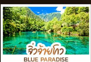
จิวจ้ายโกว BLUE PARADISE