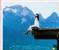
ร้านกาแฟหยุนต้ออัน