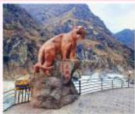
ช่องแคบลือกระโจน