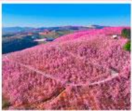
หุบเขาหยี่หลีฮยง