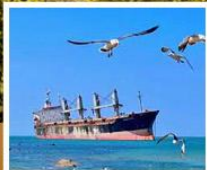
เรือสินค้าเกย์ตันบลูวิซ