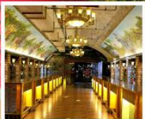
พิพิธภัณฑ์ไวน์ชิงเต่า