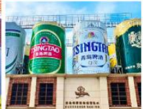
พิพิธภัณฑ์เบียร์ชิงเต่า