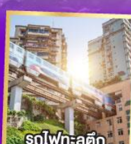
รถไฟฟ้า-สุดึก