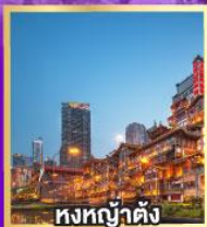
หงหน่าต้ง

เที่ยวเต็มอิ่ม..ไม่ลงร้านช้อปปิ้ง นั่งรถไฟความเร็วสูง 2 เที่ยว ไม่มีข้อพิพาทเพิ่ม