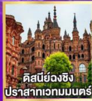
ดิสเนย์วงฉิ่ง ปราสาทเวทมนตร์