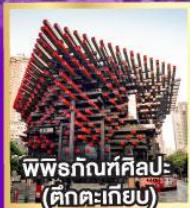
พิพิธภัณฑ์ศิลปะ- (ตึกตะเกียบ)