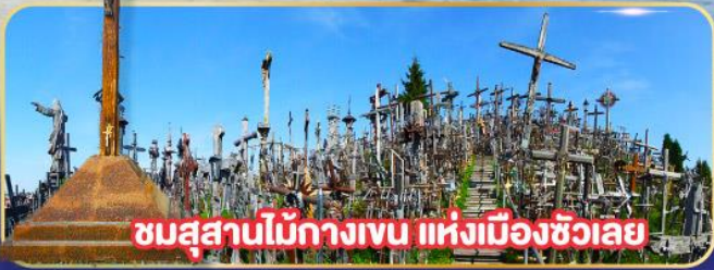
ชมสุสานไม้กางเขน แห่งเมืองซิวลเย