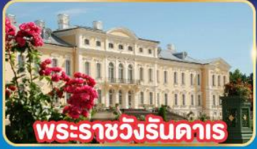
พระราชวังรินคาส