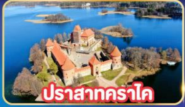
ปราสาทคราโด

พิเศษ! เที่ยวเก็บครบทุกประเทศยุโรปเหนือ ลิทัวเนีย , ลัตเวีย , เอสโตเนีย , ฟินแลนด์