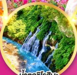
น้ำตกชิโรฮิเงะ