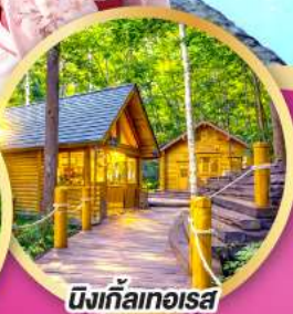
มิงเก็ลทอโรส