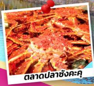
ตลาดปลาซังคะคุ

พักโอตารุ 1 คืน สัมผัสเสน่ห์สุดแสนโรแมนติก