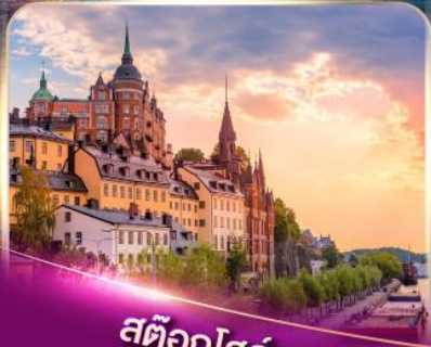
สต็อกโฮล์ม เวนิสแห่งยุโรปเหนือ