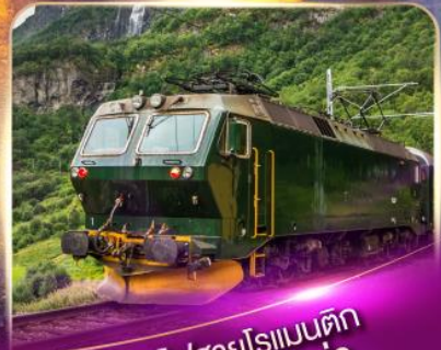
รถไฟสายโรแมนติก ฟลัมส์บาน่า