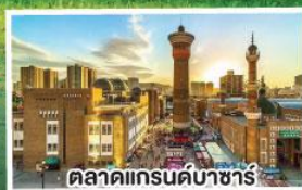
ตลาดแกรนด์บาซาร์