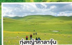
ทุ่งหญ้าคาลาจัน