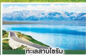
ทะเลสาบโซรัม