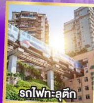
รถไฟกะลุดัก