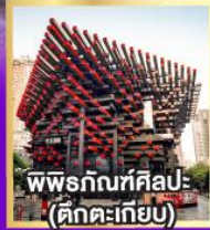
พิพิธภัณฑ์ศิลปะ (ตึกตะเกียบ)