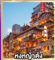
หงเต๋ยต้าตัง