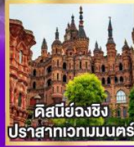
คิสนี่ยองฉิง ปราสาทเวกมมนคร