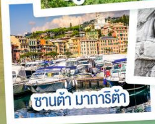
ซานต้า มาการิต้า