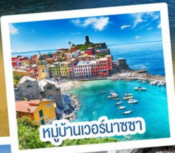
หมู่บ้านเวอร์นาซา