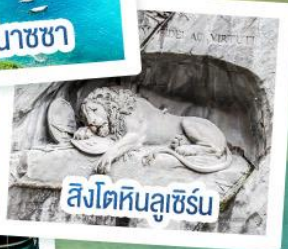
สิงโตหินลูเซิร์น