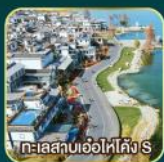
ทะเลสาบอ้อไห่โค้ง S