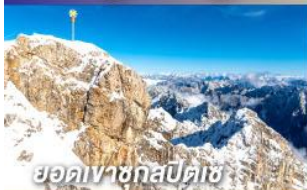
ยอดเขาชุกสปีตเซ