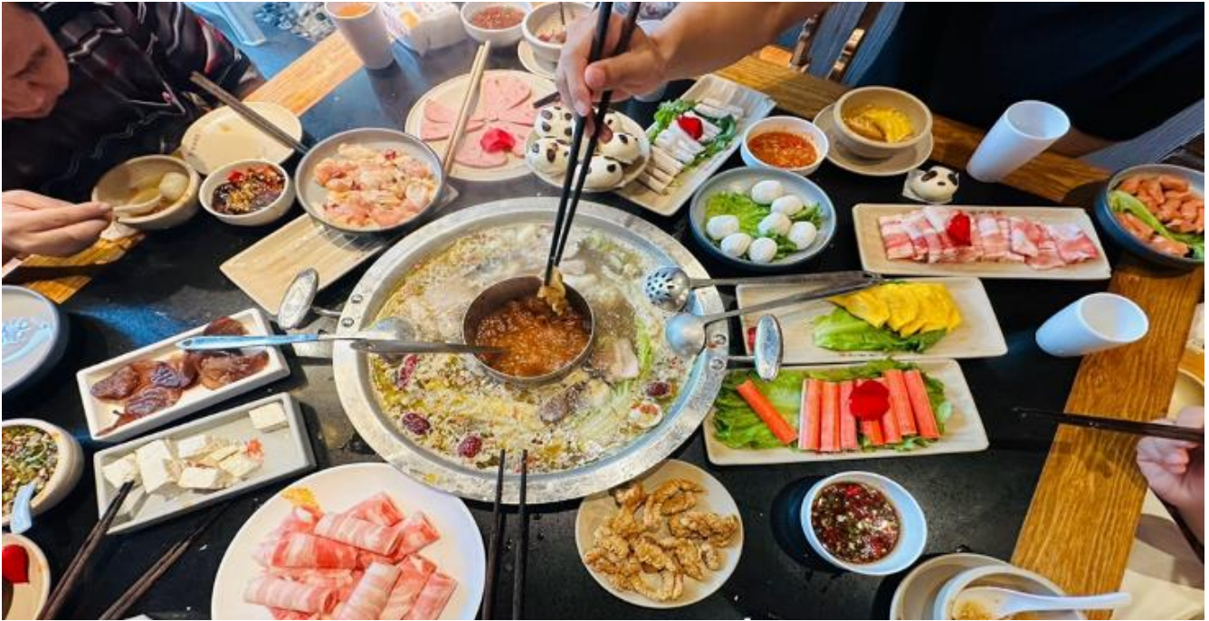
คำ รับประทานอาหารคำ ณ ภัตตาคาร (เมื่อที่ 12) *เมนูพิเศษสุกี้หมอลำเสฉวน