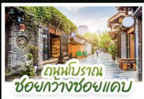
ถนนโบราณ ชอยกว้างซอยแคบ