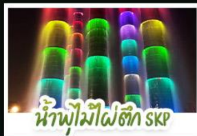
น้ำพุไม้ไผ่ตึก SKP

ภูเขาสีดรุณี • อุทยานหวงหลง • เมืองโบราณชงพาน • ทะเลสาบเต๋อซี อุทยานจิวจ้ายโกว • จิตรกรรมยักษ์พันหัว • รูปปั้นหมีแพนด้าเซลฟี่ ถนนโบราณชอยกว้างซอยแคบ • ถนนคนเดินไท่กุ๋หลี่ • ถนนคนเดินซุนซี แพนด้ายักษ์ปิ่นตึก ณ ตึก IFS • วัดต้าเจี๊ว • น้ำพุไม้ไผ่ตึก SKP