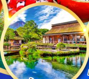
หมู่บ้านน้ำใส โอชิโนะอักษิโก