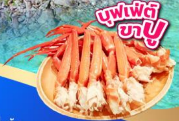
บุฟเฟ่ต์ ชาบู