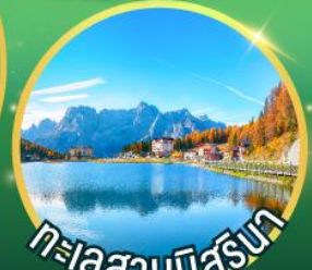
ทะเลสาบมิสุรินา

GO3FRA-SQ003 วันเดินทาง 17 - 24 ก.ย.69 / 22 - 29 ต.ค.69 8 วัน 5 คืน