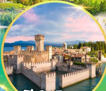
ซิริมิโอเน