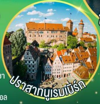
ปราสาทบูเรมเบิร์ก