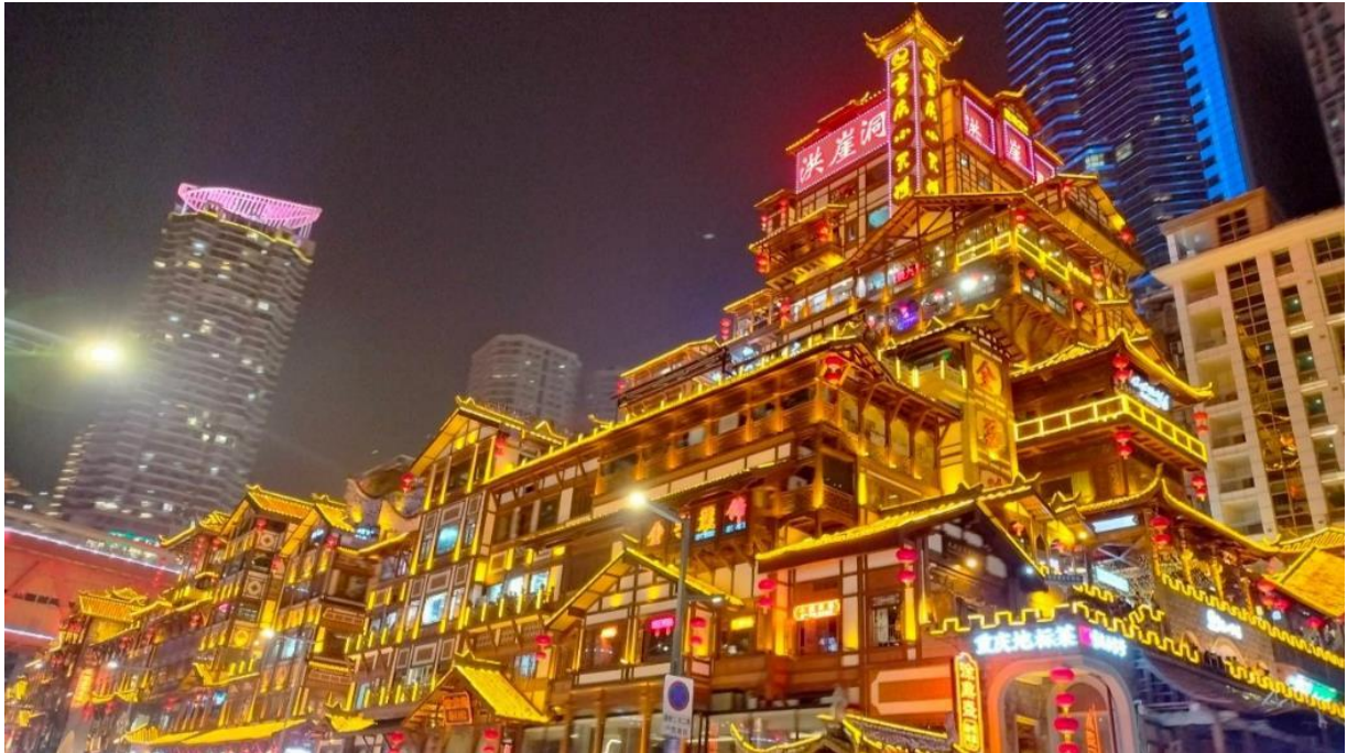
ที่พัก HOLIDAY INN SUITES CHONGQING JINHUI หรือระดับเทียบเท่า 4 ดาว

นำท่านชมความงดงามยามค่ำคืน หงหยาดัง คอมเพล็กซ์ในรูปแบบทรงอาคารโบราณขนาดใหญ่ ภายในมีร้านค้า ร้านอาหาร ร้านขายสินค้าที่ระลึก ฯลฯ ที่นี่ถือเป็นจุดนัดพบพักผ่อนของชาวเมือง และจุดชมวิวชั้นดี อีกทั้งยังเป็นจุดถ่ายรูปที่สำคัญของนักท่องเที่ยวอีกด้วย