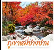
ภูเขาหมีช้างชาน