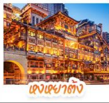
เจียงเฉาตั้ง

สัมผัสใบไม้แดงสุดงดงามที่ ภูเขาหมีช้างชาน และ ภูเขาทงอู่ชาน ชมวิวกลางคืนสุดอลังการที่ หงหยาดตั้ง แลนด์มาร์กชื่อดังแห่งฉะเชิง สักการะพระโพธิสัตว์เจ้าแม่กวนอิม ณ วัดหิ่งห้อย ขอพรเสริมสิริมงคล เช็คอินแลนด์มาร์กสุดฮิต แพนด้าปิ่นตึก IFS + POP MART ช้อปปิ้งจุใจที่ ไท่กุหลี่ ถนนคนเดินซุนซีอู๋