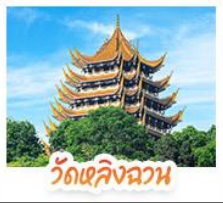
วัดเขคิงฉวน