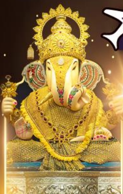
องค์ตักขุทีเศษฐ์