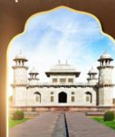
ถ้ำมาฮาน้อย