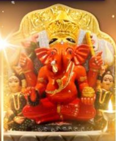
องค์สิทธินายก