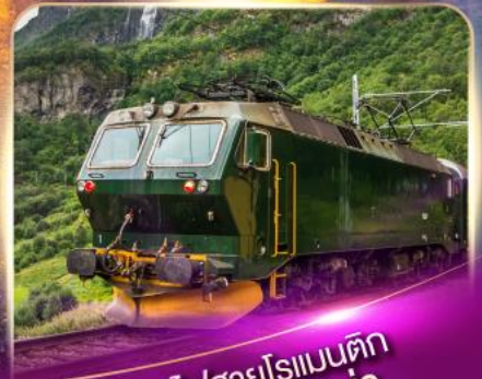
รถไฟสายโรเมนติก ฟลัมส์บาน่า