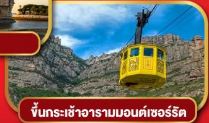
ขึ้นกระเช้าอารามมอนต์เซอรัลด์