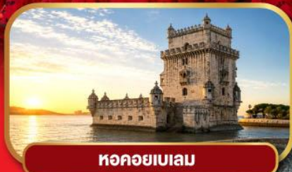
หอคอยเบเลม