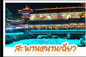
สะพานเทียนหนานเฉียว