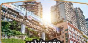
รถไฟฟ้า-สุตึก