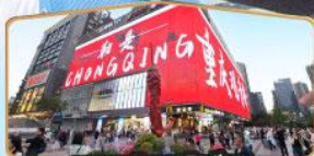
ถนนคนเดินถวณอันเฉียว