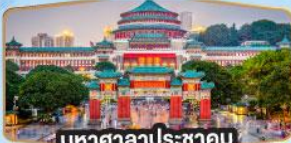
พิพิธภัณฑสถานแห่งชาติฉงชิ่ง