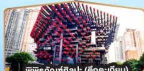
พิพิธภัณฑ์ศิลปะ (ศิลปะเทียบ)