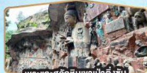
พระแกะสลักหินเว้าป่าต๋อง