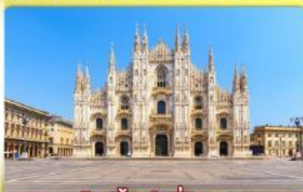
ซ็อบบิงจู่ใจที่มิลาน