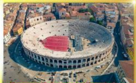
โรงละครโรมันกลางจั๊งเวโรน่า