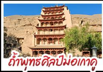
กำแพงพุทศิลปม่อเกาคู

เป็นทราจครวงญ - สระน้ำงพระจันท์ ทะเลสาบเกลือฉ่าท่า - กำพุทศิลปม่อเกาคู หุบเขาสายรุ้งจางเซ่ - ทะเลสาบซิงไห่