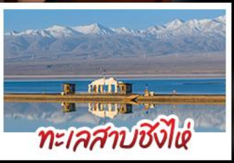
ทะเลสาบซิงไห่