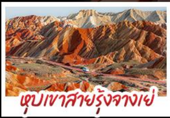
หุบเขาสายรุ้งจางเซ่