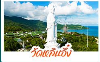
วัดเข็กินแจ็ง