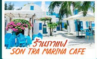
ร้านกาแฟ SON TRA MARINA CAFE