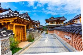
หมู่บ้านโบราณอินพยอง