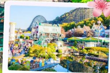
เอเวอร์แลนด์