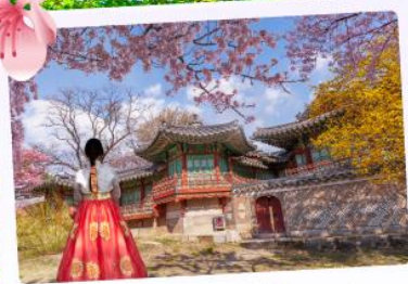
พระราชวังชางด็อกกุง