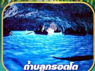
ถ้ำบลูกรอดด์