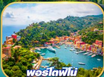
พอร์ตฟีโน