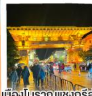
เมืองโบราณแชนกรีล่า