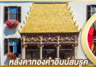
หลังคาทองคำอินน์ส์บรุค