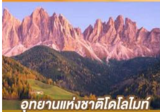
อุทยานแห่งชาติโดโลไมท์

บินตรงนครอัมสเตอร์ดัม กับเส้นทางสายโรแมนติก พร้อมการแสดงพื้นบ้านสไตล์กิโรเลียนสุดพิเศษ