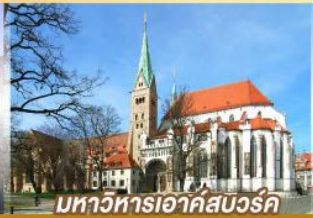
มหาวิหารเอาค์สบวร์ค